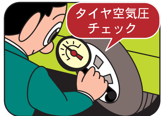
タイヤのエアバルブ（空気入れ）のキャップを外し、そこにタイヤゲージの口金を入れて測定します。

○灯火類の点検後に、フロントガラスやリアガラス等のウインドガラスやドアミラーの汚れなども点検しておきましょう。