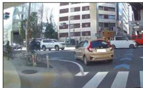
歩車分離式信号の導入された交差点

今号では、歩行者事故の現状を確認し、左折時を中心にその危険性と対策について考えましょう。