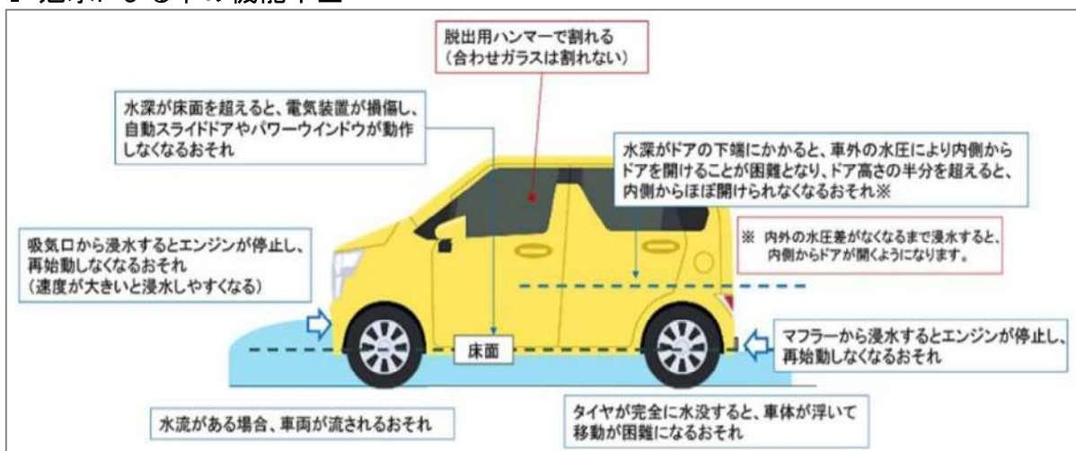
※2.国土交通省Webサイト「水深が床面を超えたら、もう危険！ - 自動車が冠水した道路を走行する場合に発生する不具合について」 https://www.mlit.go.jp/report/press/jidosha08_hh_003565.html (2020.10.5.閲覧)