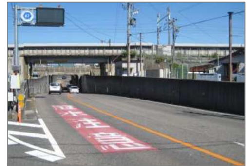
2016年9月水没による重大事故が発生した地点

今回は、車の水没事故を、車の機能や避難器具、心の働きなどから理解し、その危険回避について考えてみましょう。