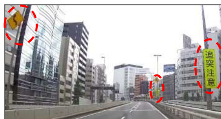
S字カーブと追突注意