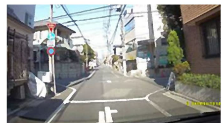
▲自転車やオートバイが飛び出してくるかも!